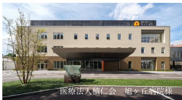
医療法人積仁会 旭ヶ丘病院様

弊社としましては、このようなクリエイティブな 仕事に携わることができましたことに、感謝と 喜びでいっぱいです。今後も煉瓦の可能性を追求 してまいりたいと思っています。