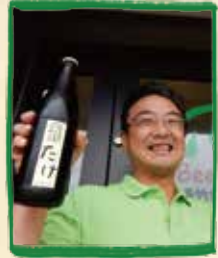
真備竹林麦酒醸造所