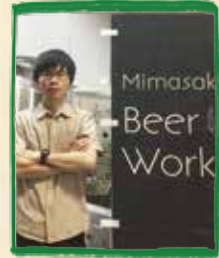
美作ビアワークス