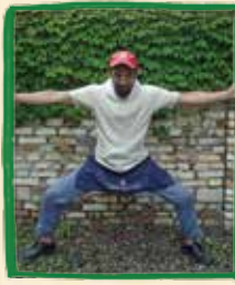
三石耐火煉瓦ビール