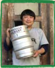
アルマジロブリュワリー