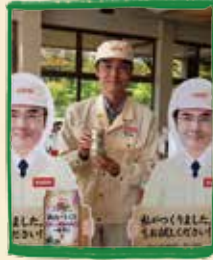
キリンビール岡山工場