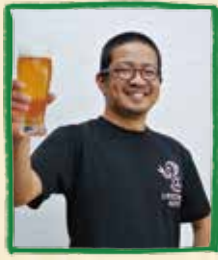
吉備土手下麦酒醸造所