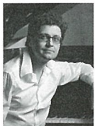
ミロスラフ・セケラ(ピアノ) Miroslav Sekera, Piano

フランス、パドカレ出身。7歳より音楽を学ぶ。パリ国立高等音楽院(CNSM)を首席で卒業。ピエール・ブーレーズに招かれアンサンブル・アンテルコンタンポランに12年間在籍。またソリストとして世界中の主要都市での演奏、各地の批評家たちから多くの称賛を得ている。これまでにチェリビダッケ、ヨッフム、マーゼル、バーンスタイン、ムーティ、小澤征爾といった巨匠指揮者たちと共演。若手音楽家の指導にも力を注いでいる。パリ木管五重奏団メンバー。