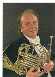
ホルン ジャック・デルプランク フランス国立トゥールーズ・ キャピトル管弦楽団首席 パリ国立高等音楽院教授