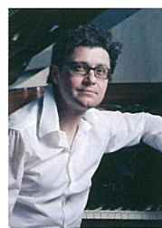
ピアノ ミロスラフ・セケラ プラハの春音楽祭公式ピアニスト プラハ芸術大学所属 ソリスト