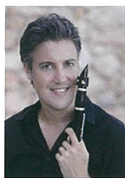
クラリネット パトリック・メッシーナ フランス国立管弦楽団首席 ロンドン王立音楽院客員教授 パリエコールノルマル音楽院教授